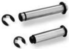
Art.-Nr. 1126040 Art.-Nr. 1226060

Stifte passend für STAR - SPANNFINGER Pins suitable for STAR - CHUCK LEVER