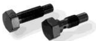
Art.-Nr. 3999930 Art.-Nr. 3999940