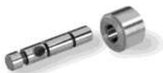
Art.-Nr. 3925170 Art. Nr. 3925180