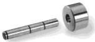
Art.-Nr. 3926190 Art.-Nr. 3926210