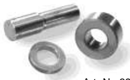
Art.-Nr. 3926310 Art.-Nr. 3926320 Art.-Nr. 3926330